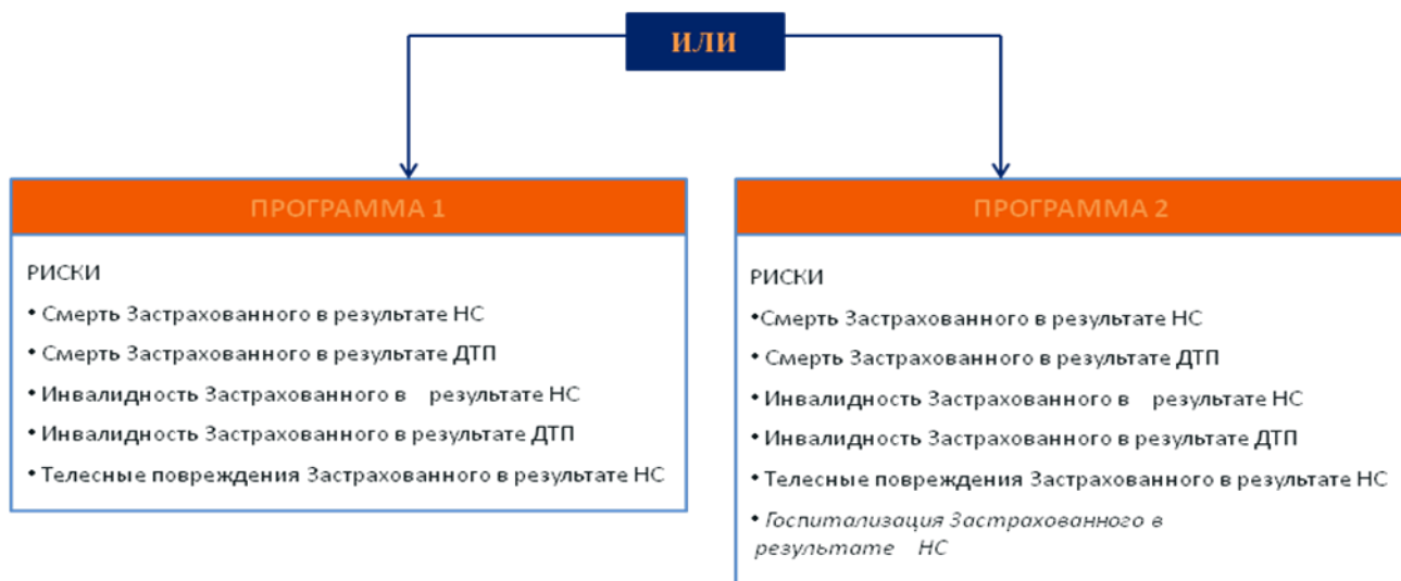
Рисунок 1. Структура продукта «Вариант»

В договор страхования по продукту «Вариант» может быть включена только одна программа на выбор.